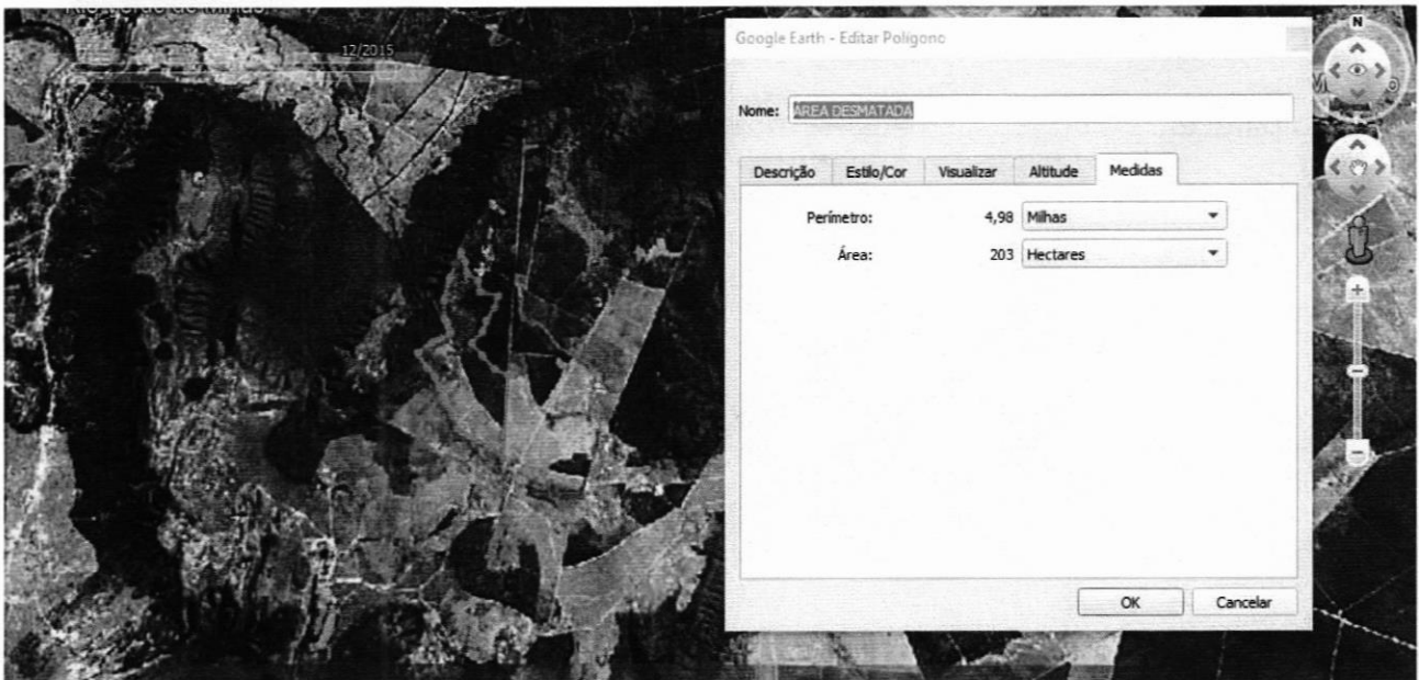
Figura 2. Imagem do Google Earth de dezembro de 2015, onde já se visualiza intervenções na porção inferior do polígono com retirada de vegetação menos densa.