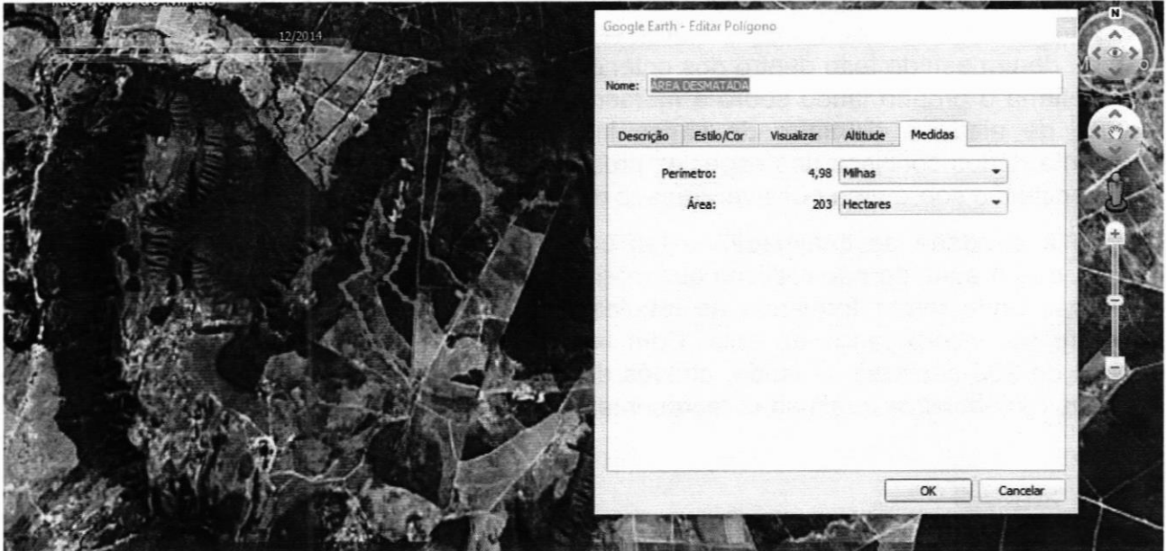
Figura 1. Imagem do Google Earth de dezembro de 2014 onde mostra parte da área com uma vegetação menos densa e outra mais densa.