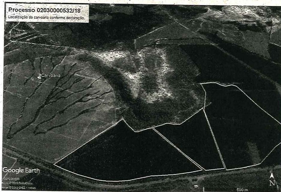
Localização da carvoaria – Fazenda São Sebastião (matrícula 27.991).

Imagem datada de 24/10/2018 gerada pelo programa Sentinel Hub onde é possível observar que a exploração já teve início.