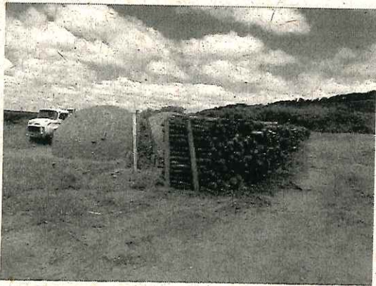
Carvoaria - Fazenda São Sebastião (matrícula 27.991).