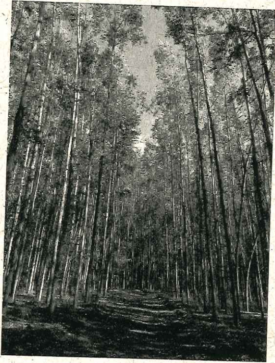
Área de exploração - Fazenda São Sebastião (matrícula 26.074).