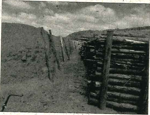
Carvoaria - Fazenda São Sebastião (matrícula 27.991).