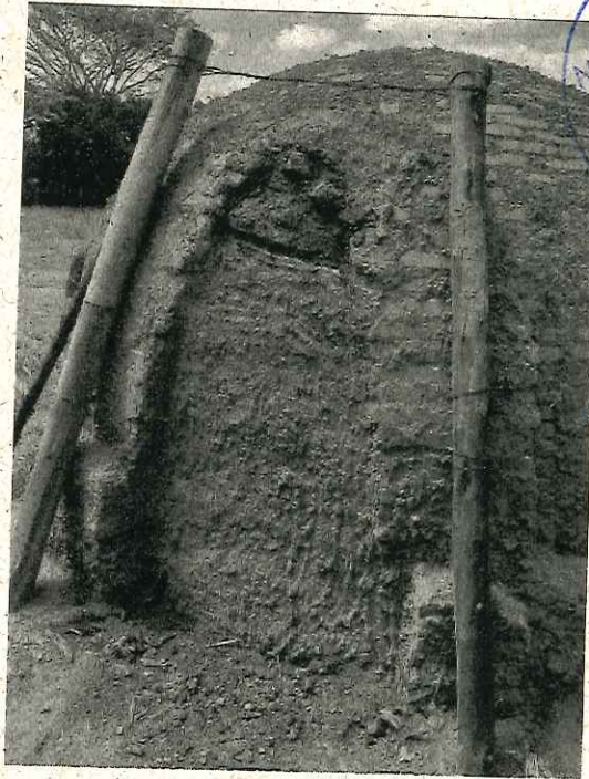
Forno lacrado com carvão dentro - Fazenda São Sebastião (matrícula 27.991).