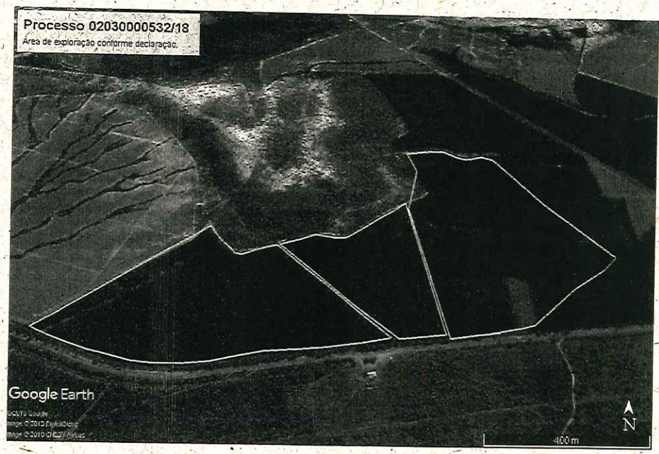
Poligonal de exploração declarada – Fazenda São Sebastião.