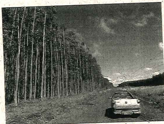
Área de exploração - Fazenda São Sebastião.