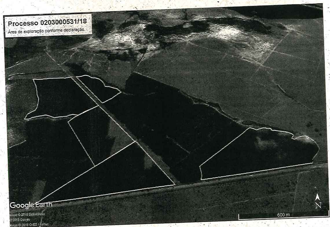
Poligonais de exploração declaradas – Fazenda São Sebastião.