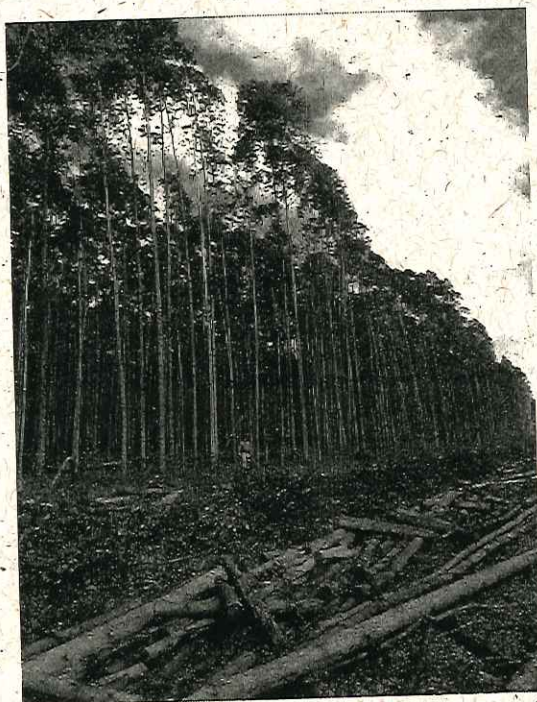
Área declarada e exploração já iniciada - Fazenda São Sebastião