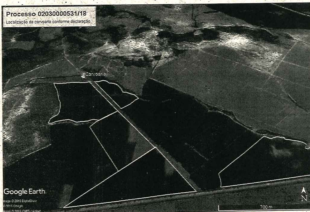
Localização da carvoaria – Fazenda São Sebastião.

Imagem gerada pelo programa Sentinel Hub datada de 24/10/2018, onde é possível observar que a exploração da área já teve início.