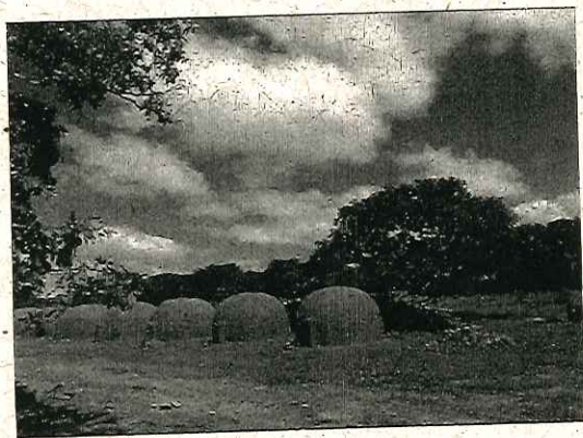
Carvoaria - Fazenda São Sebastião.